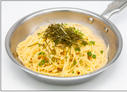
pollack roe oil pasta