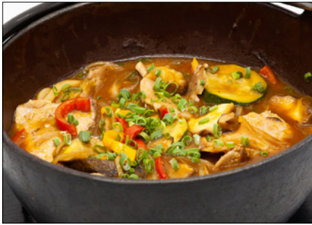
pork belly curry udon