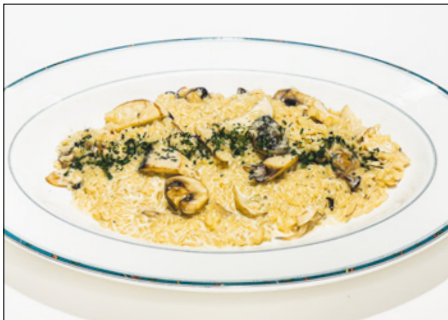
mushroom cream risotto 버섯 크림 리조또