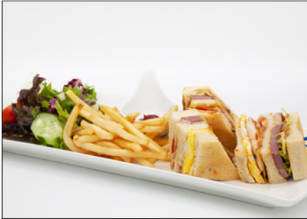
club sandwich 클럽 샌드위치