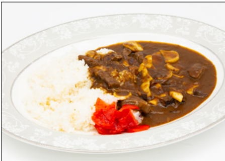
beef & mushroom curry rice