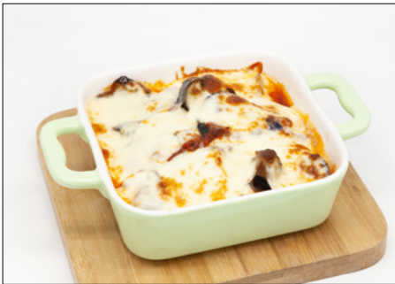
eggplant meat sauce lasagna 미트소스 가지 라자냐