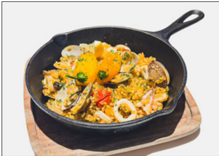
seafood & chicken paella