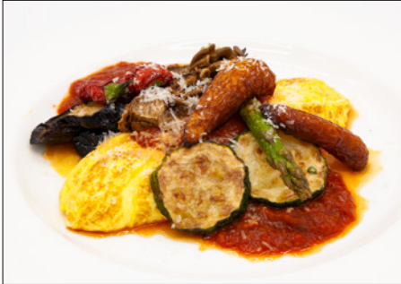
grilled vegetable tomato sauce omelet