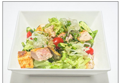
sautéed chicken salad in soy dressing 간장 드레싱 소테치킨 샐러드