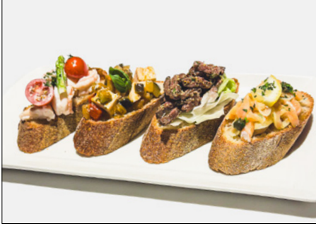
4 kinds bruschetta (beef, chicken, shrimp, salmon marinade)