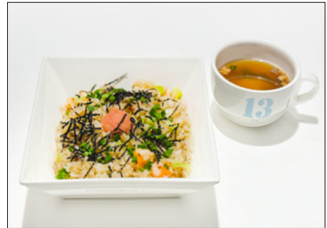
shrimp and squid fried rice with pollack roe