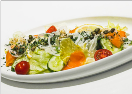
fresh salmon salad