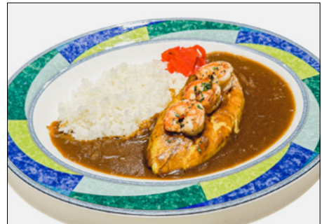
shrimp omelet curry rice