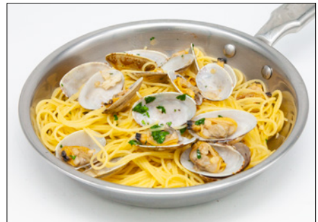
vongole anchovy oil pasta