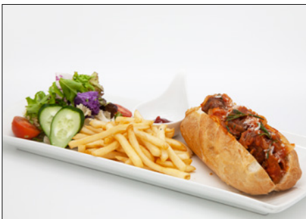
meatball baguette sandwich 미트 볼 바게트 샌드위치