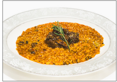
beef tomato sauce risotto