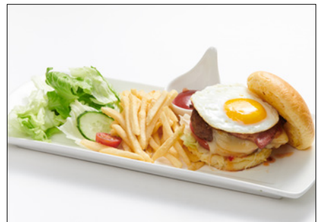
fried egg & bacon cheese burger 계란 후라이 & 베이컨 치즈 버거