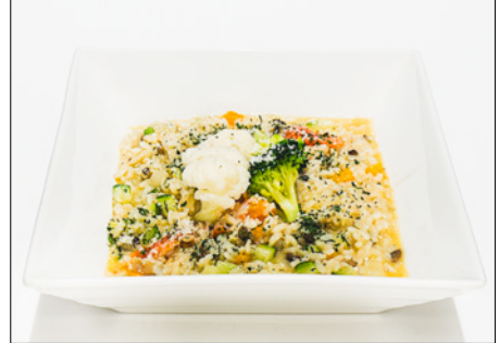
vegetable cheese risotto 야채 치즈 리조또