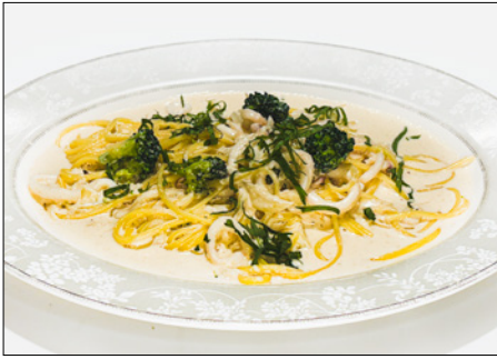
pollack roe & squid cream pasta 명란 오징어 크림 파스타