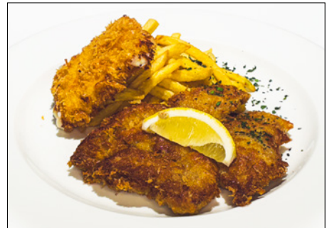
lemon flavored veal cutlet