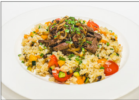
beef fried rice