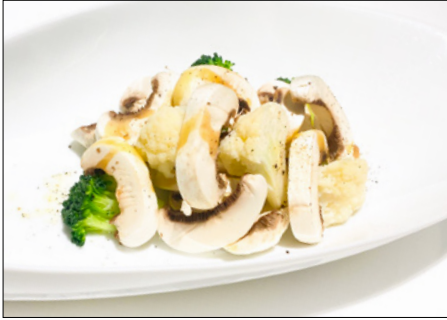
truffle flavored raw button mushroom & broccoli salad 트러플 풍미 양송이 브로컬리 샐러드