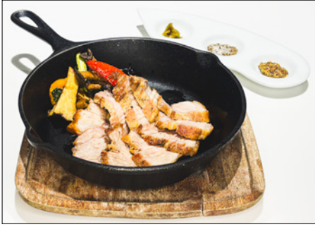
roasted pork belly