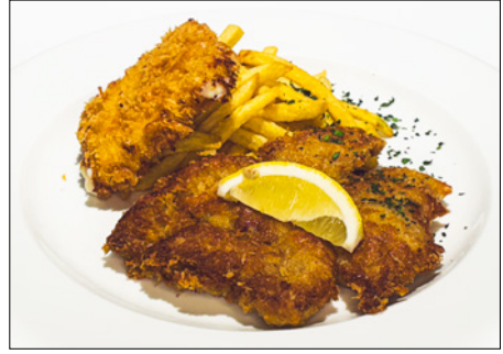
lemon flavored veal cutlet