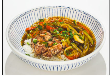
chinese style chicken donburi