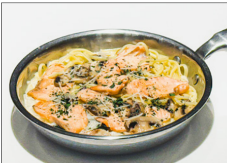
salmon & spinach cream pasta