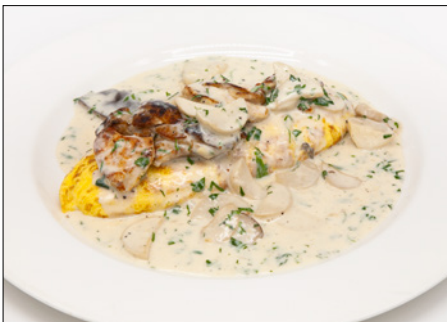
chicken mushroom cream sauce omelet