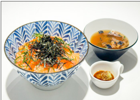
fresh salmon & salmon roe donburi 프레쉬 연어와 연어알 돈부리