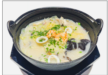
seafood white ramen (scallop, shrimp, squid)