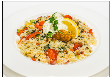
scallop fried rice