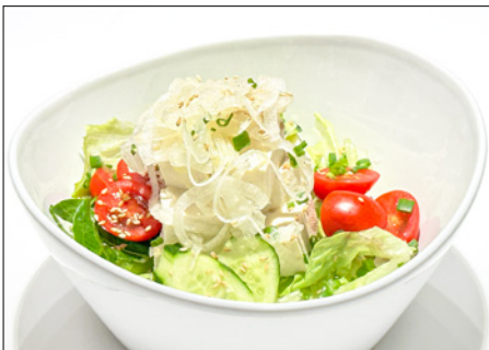
tofu salad in sesame dressing 깨 드레싱 두부 샐러드