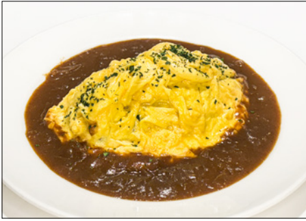
curry omurice with vegetable buttered rice