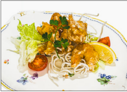
mayonnaise fried shrimp