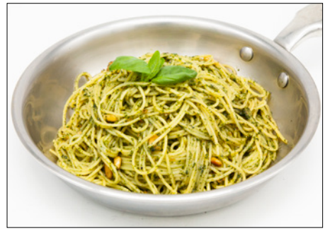
genovese anchovy (basil pesto) pasta