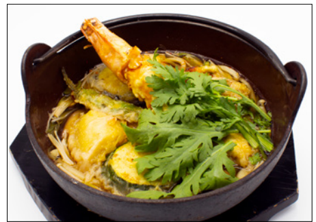
fried king prawn tempura udon with vegetable