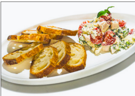
chicken cream cheese spread with sliced baguette