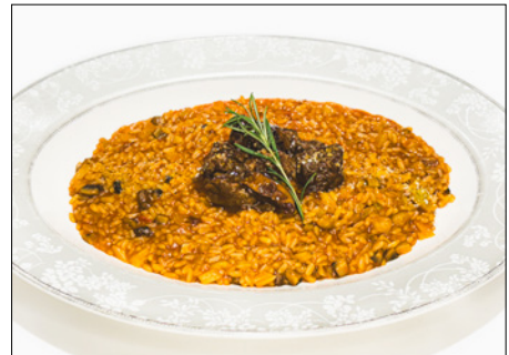
beef tomato sauce risotto 소고기 토마토 소스 리조또