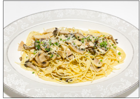
truffle flavored mushroom oil pasta