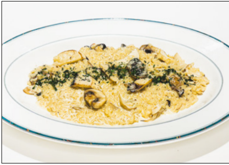
mushroom cream risotto