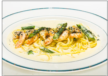
shrimp cream pasta with asparagus & broccoli