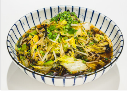
vegetable ramen (soy sauce or miso) 야채 라면 (간장 또는 된장)