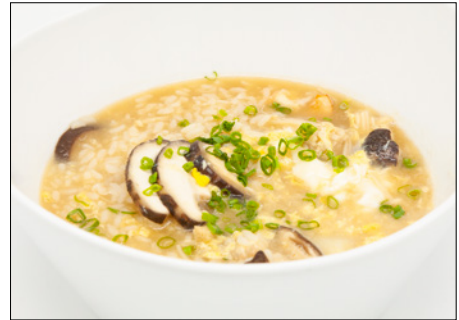
scallop & shrimp, mushroom soy sauce rice porridge