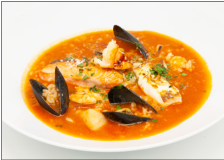
seafood tomato rice porridge