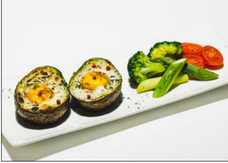
roasted avocado with egg