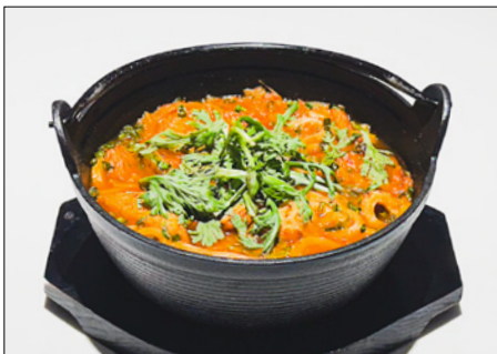
kimchi oden udon