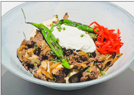
bulgogi rice 불고기 덮밥