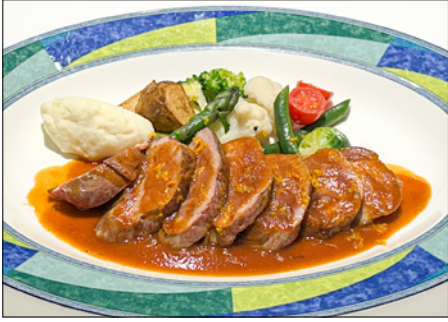
duck breast steak with orange sauce 오렌지소스 오리 가슴살 스테이크