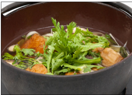
oden sanuki udon