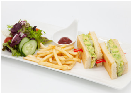
avocado & vegetable sandwich 아보카도 & 야채 샌드위치