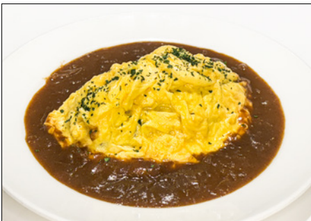
curry omurice with vegetable buttered rice 야채 버터 라이스를 넣은 커리 오므라이스