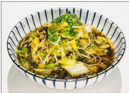
vegetable ramen (soy sauce or miso)