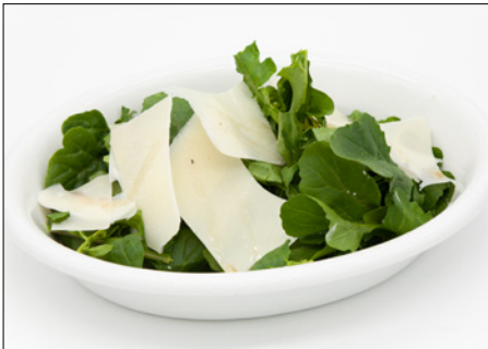
rucola & parmesan cheese salad with walnut oil 월넛 오일 루콜라 파마산 치즈 샐러드