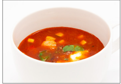
mozzarella & basil tomato soup with bacon