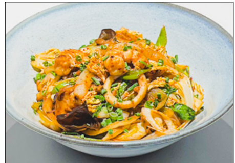
jjamppong rice 짬뽕 덮밥