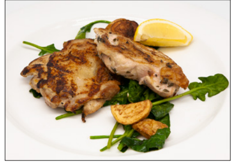
lemon flavored sauteed chicken (200g)