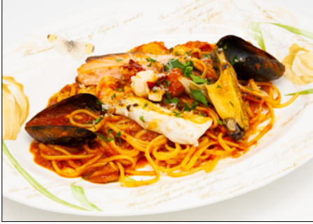
seafood anchovy tomato pasta