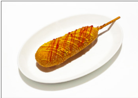
The Restaurant sausage corndog