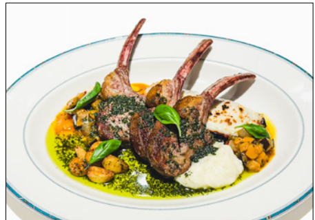
lamb (210g) in basil sauce with ratatouille 라따뚜이를 곁들인 바질 소스 양고기