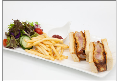
pork cutlet sandwich 포크 컷렛 샌드위치