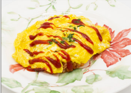
plain omurice (bacon ketchup rice) 플레인 오므라이스