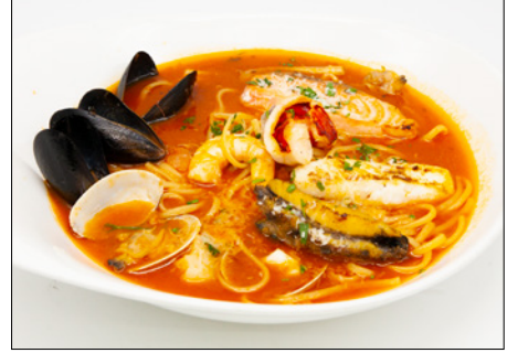
spicy seafood anchovy tomato pasta