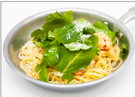
shrimp rucola anchovy oil pasta