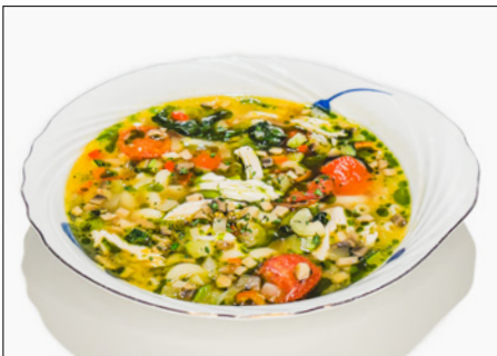
chicken soup with macaroni & vegetable