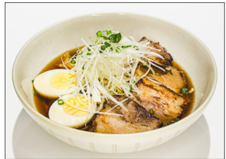
char siu ramen (soy sauce or miso)