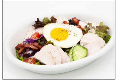
chicken & bacon caesar salad with fried egg 반숙 계란을 곁들인 치킨 베이컨 시저 샐러드