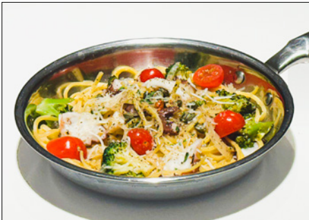
octopus anchovy oil pasta