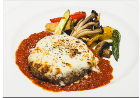
cheese hamburger steak with tomato sauce