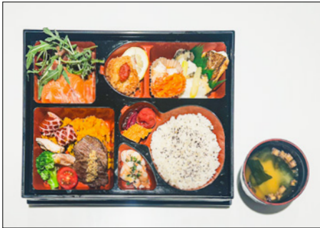
special lunch box 스페셜 도시락