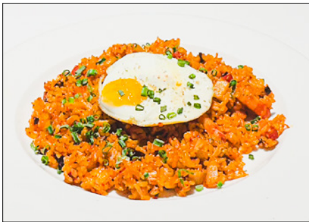
kimchi fried rice with bacon