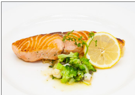
salmon steak (120g) in garlic sauce 마늘소스 연어 스테이크