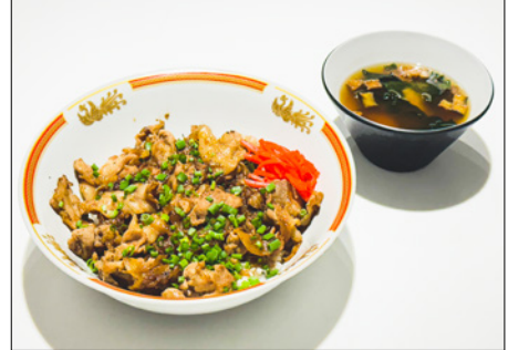
pork & ginger donburi 부타동