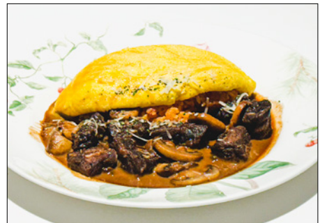
beef stroganoff omurice (bacon ketchup rice) 비프 스트로가노프 오므라이스