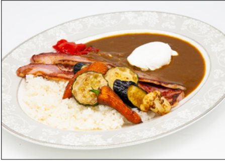
vegetable & bacon curry rice with poached egg