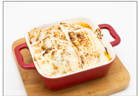
meatball tomato sauce lasagna 미트볼 토마토 소스 라자냐