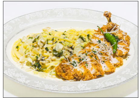
spicy cream pasta with thyme