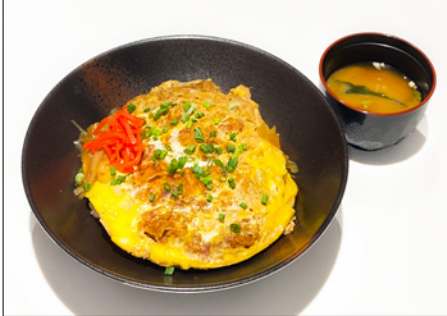
pork cutlet donburi 가츠동