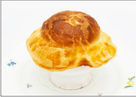
truffle flavored mushroom cream soup with puff pastry top