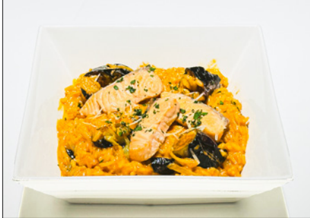
salmon & eggplant rose risotto 연어 가지 로제 리조또