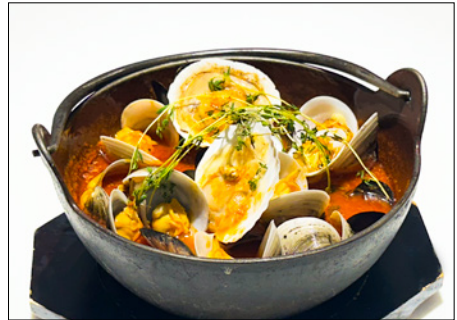
marseille style garlic tomato mussel & clam stew (normal or spicy) 마르세유 풍 홍합 조개 마늘 토마토 스투