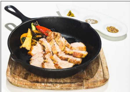
roasted pork belly