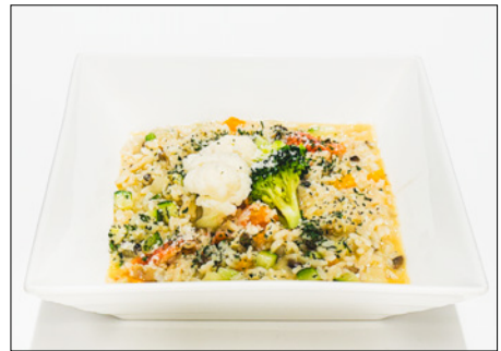
vegetable cheese risotto