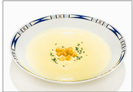
corn cream soup