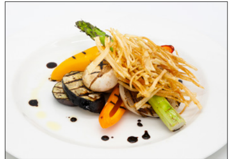
grilled vegetable salad in balsamic dressing 발사믹 드레싱 그릴 야채 샐러드