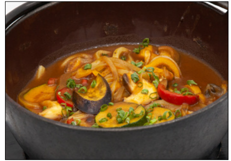
vegetable curry udon