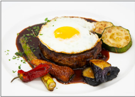
hamburg steak (200g) in pepper sauce