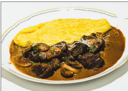
beef stroganoff omelet