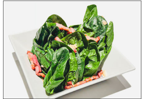
spinach salad with bacon, walnut oil dressing