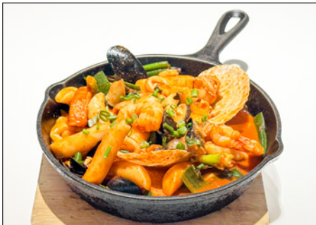
spicy seafood stir-fried rice cake (seafood topokki) (add boiled eggs +1.0) 매운 해산물 떡볶이 (삶은 계란 추가시 +1.0)