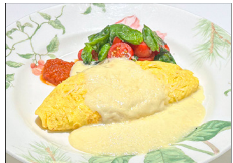
cheese omelet with tomato salad