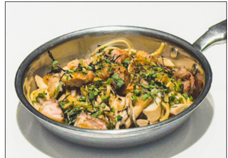
chicken & mushroom soy sauce pasta