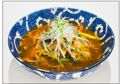
spicy vegetable noodle (konjac / udon / ramen / tofu) 매운 야채 면 (곤약 / 우동 / 라면 / 두부면)