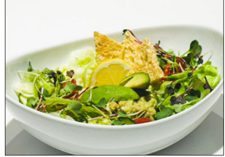
shrimp avocado salad in mayonnaise sauce