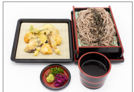
cold soba with tempura