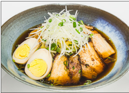
char siu vegetable ramen (soy sauce or miso) 차슈 야채 라면 (간장 또는 된장)