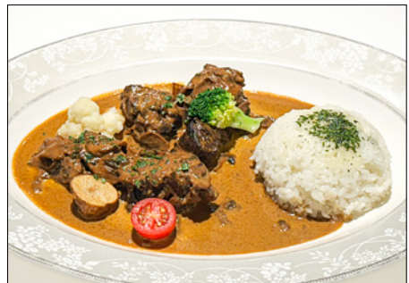
beef stew with buttered rice in red wine cream sauce 레드 와인 크림소스로 만든 비프 스투 버터 라이스