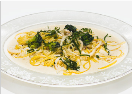
pollack roe & squid cream pasta