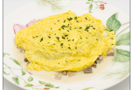
chicken mushroom cream sauce omurice (bacon ketchup rice) 치킨 버섯 크림 소스 오므라이스