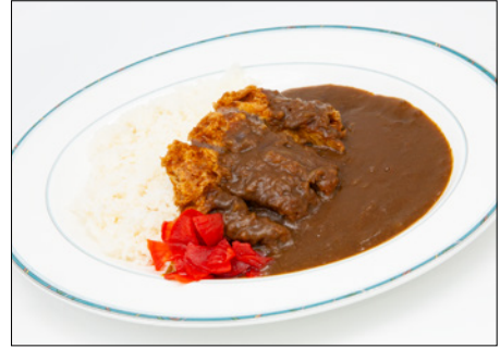
pork cutlet curry rice