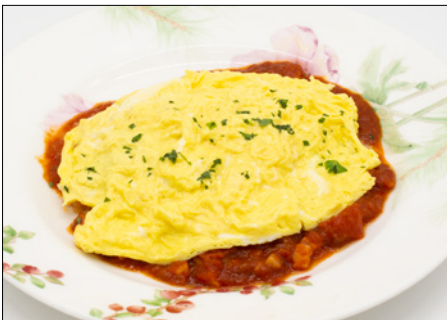
bacon tomato sauce omurice (bacon ketchup rice) 베이컨 토마토 소스 오므라이스