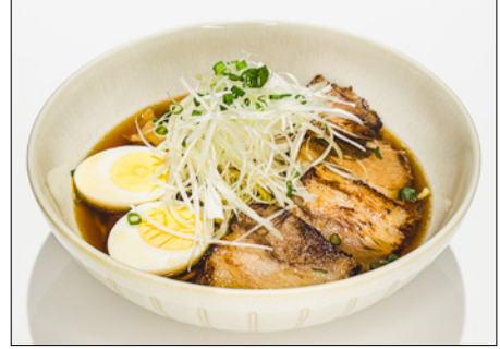
char siu ramen (soy sauce or miso) 차슈 라면 (간장 또는 된장)