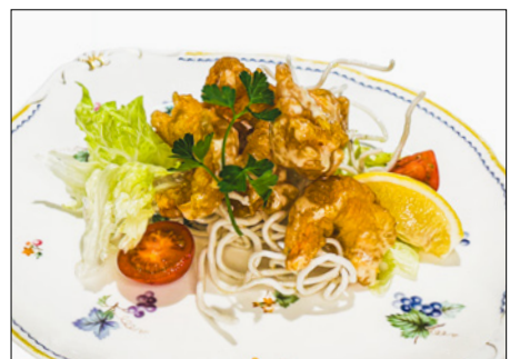
mayonnaise fried shrimp