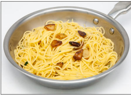
aglio e olio pasta