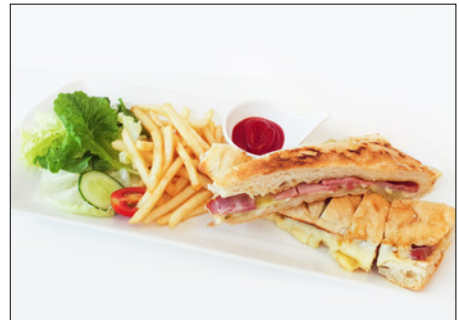
spicy jalapeño ham, cheese hot sandwich