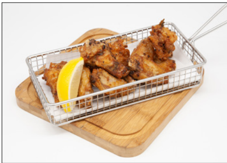
fried chicken wings