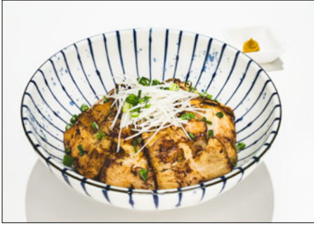
char siu donburi