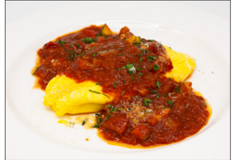
tomato sauce omelet with bacon